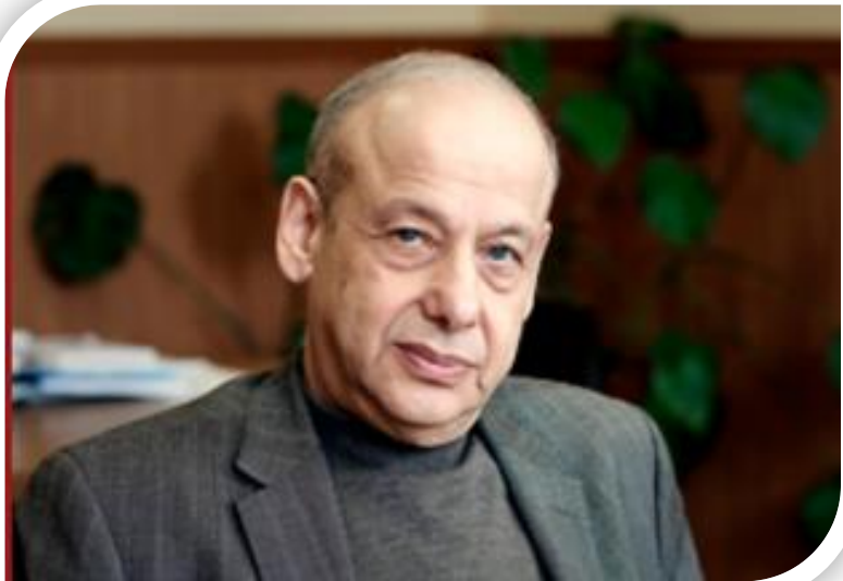
Александр Григорьевич Асмолов

«Пока мы не поймем, что школа это не только передача и трансляция знаний, мы ничего в ней не изменим. Первый и главный ценностный ориентир – понимание школы как пространства общения, диалога между поколениями»